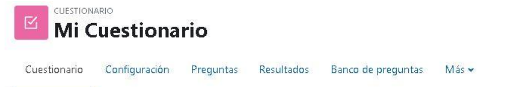
Figura 4: Pestañas de administración de un cuestionario

En la figura 4 se muestran las pestañas de trabajo con un cuestionario.