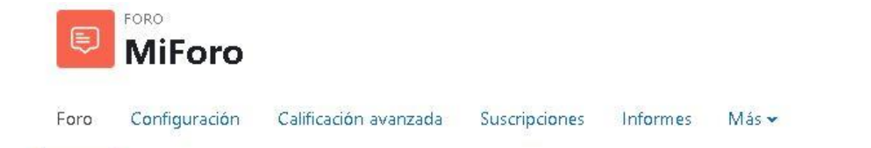
Figura 5: Pestañas de administración de un foro

Las opciones y herramientas de trabajo con los foros aparecen en las pestañas de la figura 5