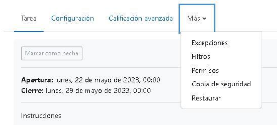
Figura 2: Pestañas de administración de una Tarea