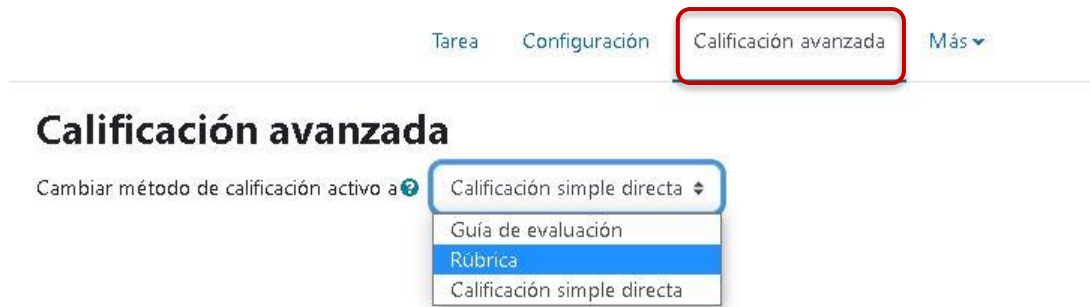
Figura 3: Pestaña Calificación avanzada .